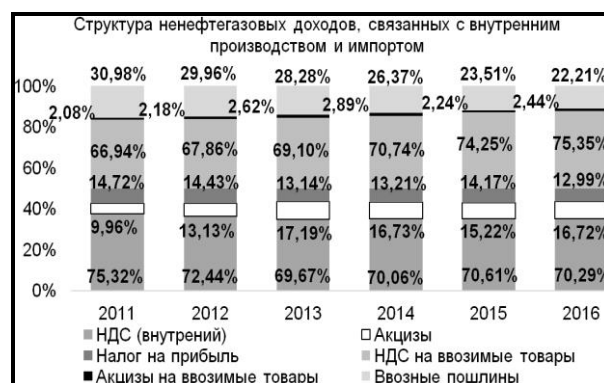
Рис. 4. Структура ненефтегазовых доходов, связанных с внутренним производством и импортом [14]

Суммируя вышесказанное, стоит отметить, что обозначенные негативные проявления в экономической системе влияют на возникновение рисков бюджетной системы. В частности, отсутствие диверсифицированной экономики и падение совокупного