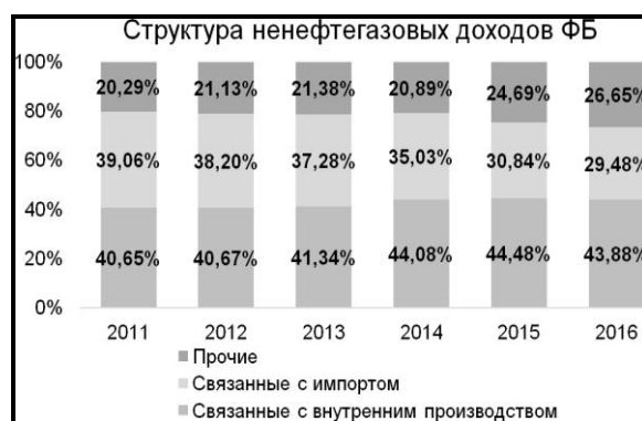
Рис. 3. Структура ненефтегазовых доходов федерального бюджета [14]

Другими словами, падение совокупного спроса повлекло за собой сокращение ненефтегазовых поступлений в федеральный бюджет. Повышение доли доходов от НДС на ввозимые товары в связи с курсовой переоценкой (номинальный рост) положительно повлияло на доходную статью бюджета, но не восполнило потерь от недополучения нефтегазовых доходов.