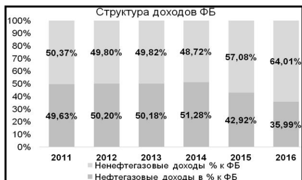
Рис. 2. Структура доходов федерального бюджета [14]

Структура доходов федерального бюджета формируется за счет поступлений нефтегазовых и ненефтегазовых доходов, динамика и структура которых представлены на рис. 2-4.